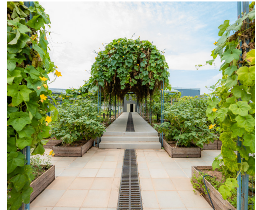
VƯỜN SINH HỌC