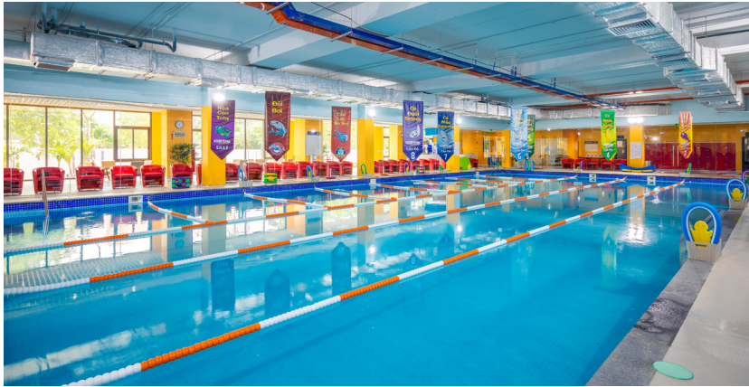
TRƯỜNG BƠI QUỐC TẾ AQUA-TOTS