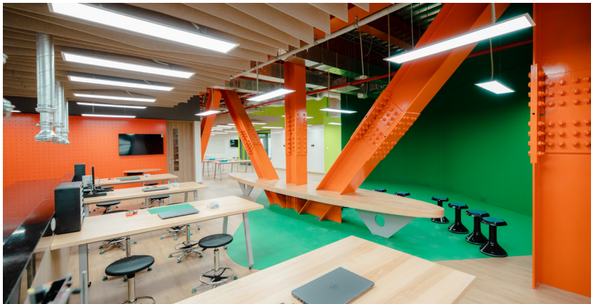
XUỐNG SÁNG CHẾ (MAKERSPACE)